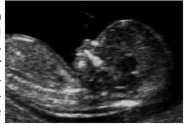
First Trimester Screening

In der 12.-14. Schwangerschaftswoche (SSW) können mit Ultraschall früh sichtbare und schwerste kindliche Fehlbildungen diagnostiziert werden. Mit Hilfe der Kombination kleinster Veränderungen im Ultraschall (z.B. erhöhte Nackentransparenz) und einer speziellen Blutabnahme kann das Risiko für häufige genetische Erkrankungen (z.B. Down Syndrom) berechnet werden (= Combined Test). Eine begleitende ärztliche Beratung ist dafür erforderlich.